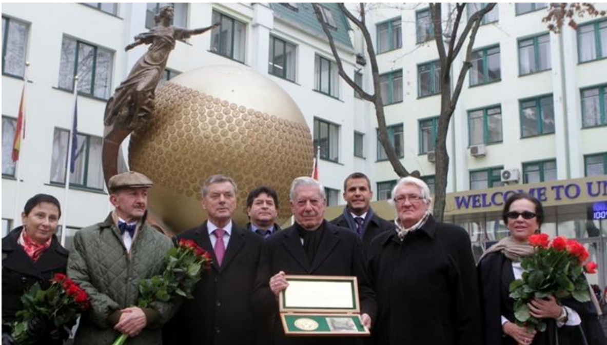
З іменною медаллю, присвяченою нобелівським лауреатам

– «Майстер і Маргарита», мені здається, одне з кращих творів у світовій літературі. Я читав його не одного разу – правда, не в оригіналі, а англійською.